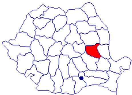
Județul Vrancea, Romania